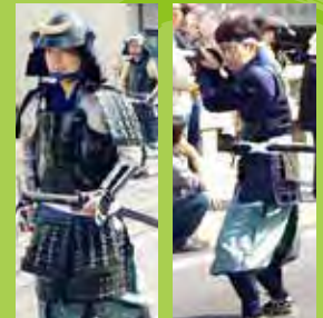
①甲冑武者(黒) ②足軽(畳鎧) …定員5名 …定員5名

県外在住で練習会に参加できない。 でも、武者行列に参加してみたい! そんな要望にお応えし、当日に、ぱっと 参加できる甲冑・衣装がセットになった プランです。