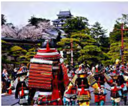
令和7年最優秀賞 / 黒川政治「入城」